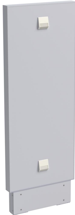
Montage TOTEM – Hauteur caisson 2200mm + 300mm rehausse