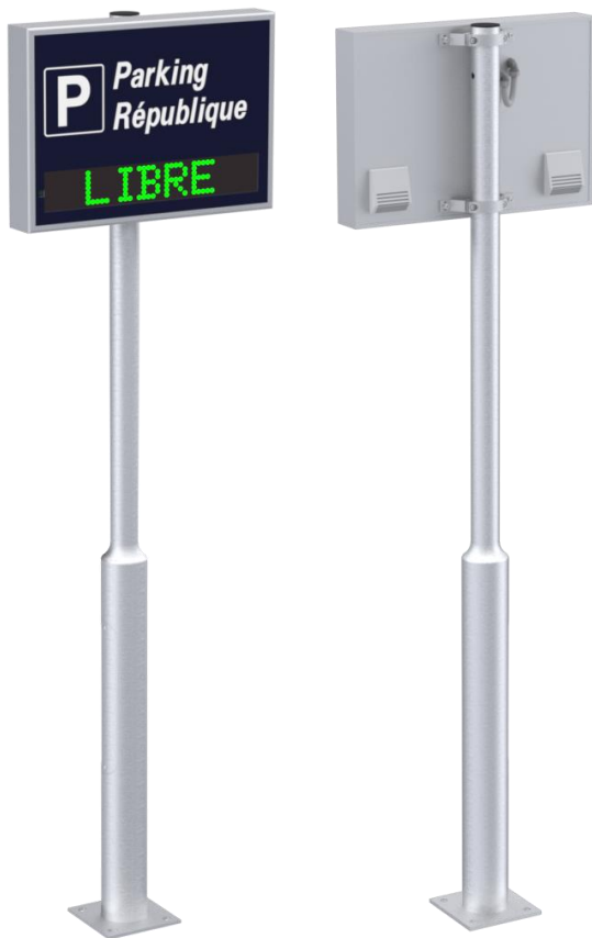
Montage sur mât – Hauteur sous caisson 2m30 typique

Série 850x600-95T2 (bi-texte) ou 850x600-95T3 (tri-texte) sur mât / mural