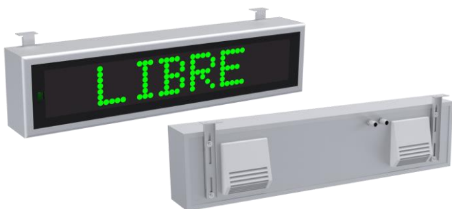
Montage sous plafond