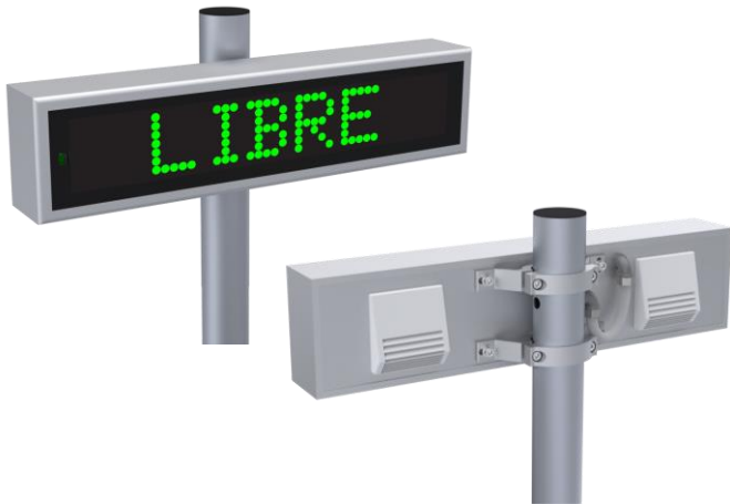
Montage sur mât – Hauteur sous caisson 2m60 typique

Série 850-95T2 (bi-texte) ou 850-95T3 (tri-texte) sur mât / mural / sous plafond