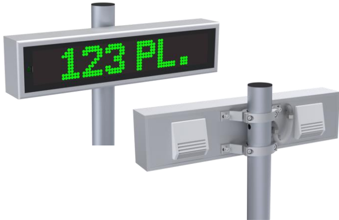
Montage sur mât – Hauteur sous caisson 2m60 typique

Série 850-95S (Monochrome) / 850-95SRV (Trichrome) sur mât / mural / suspendu