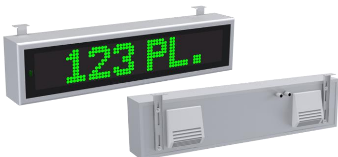
Montage sous plafond