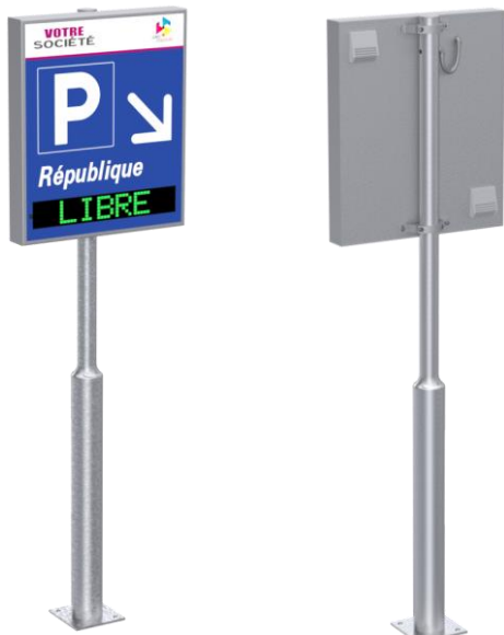
Montage sur mât – Hauteur sous caisson 1m90 typique

Série 850x1000-95T2 (bi-texte) ou 850x1000-95T3 (tri-texte) sur mât / mural