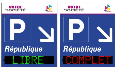
Exemple d'affichage de la version bi-texte