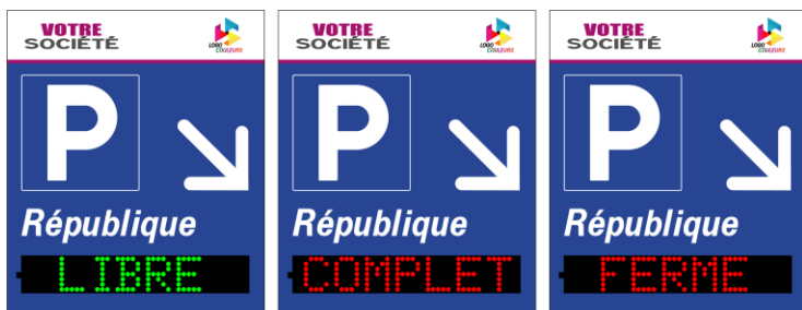
Exemple d'affichage de la version tri-texte