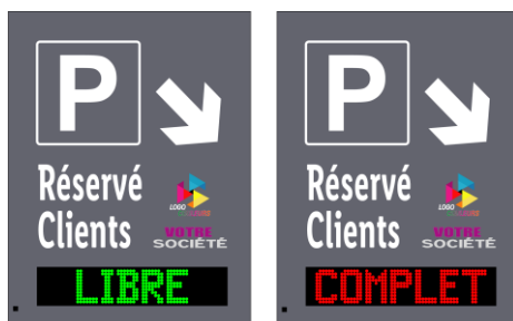
Exemples d'affichage de la version bi-texte