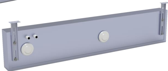
Montage sous plafond