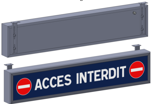
Montage sous plafond