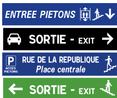
Exemples de décors de faces réalisables sur demande