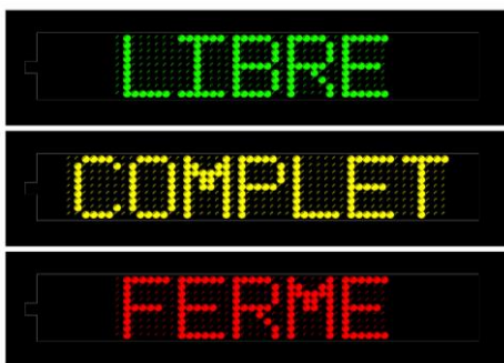
Exemple d'affichage de la version 95T3