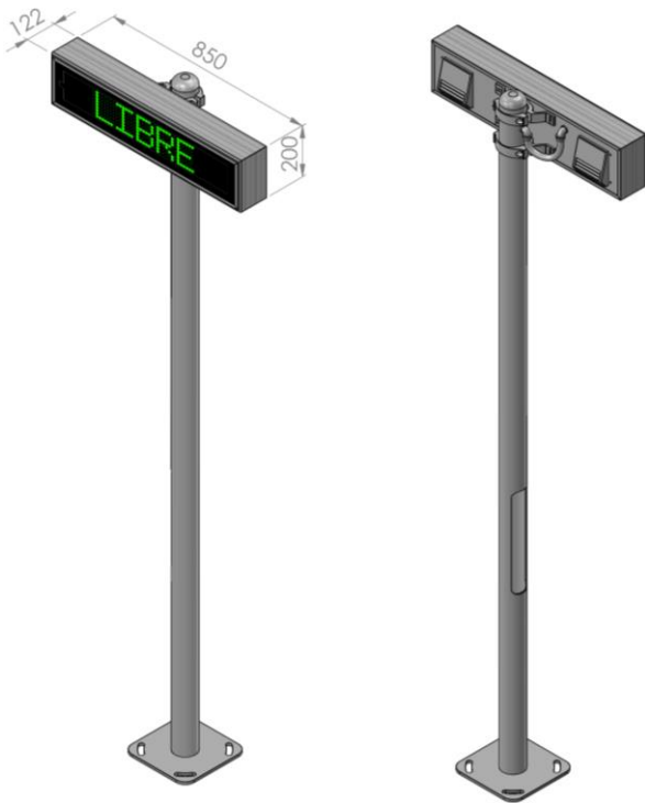
Montage sur mât