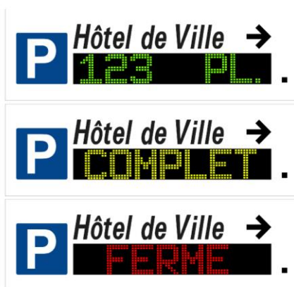
Exemple d'affichage de la version 95SRV (trichrome)